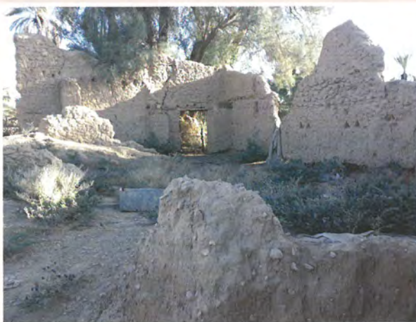
أنقاض قصر آل تركي بمزرعة الهاشمية بجلاجل