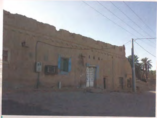
أفقاض قصر الإمارة بجلاجل بعد سيل ١٤٠٦ هـ، مع بعض البيوت الملحقة لأسرة آل سويد أمراء جلاجل

حرب منذ أكثر من ستمائة سنة، وجيرانهم من العارفين، من أمراء عتيبة وغيرهم يعرفون هذا، ومع هذا فنحن نقول: حليف القوم منهم، ولكن ما ذكرناه لبيان الحقيقة، والله أعلم، ودخول القبائل بعضها في بعض كثير، فقد دخل من الدواسر هوامل مطير في مطير، وآل محيا أهل ساجر في عتيبة وغيرهم.