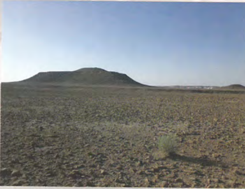
جبل أم عنيق بجلاجل

جلاجل، وآل سلمان أهل جلاجل، وأهل الروضة، وآل عمران أهل العوده، وآل خميس وآل سويلم وآل عيسى في ثادق، يجتمع هؤلاء وغيرهم في عامر بن بدران، ولذا اشتهروا بأل عامر، ولذا يقول حميدان الشويعر في قصيدته التي يعتذر فيها من الأمير سويد بن عامر، ويمدحه: